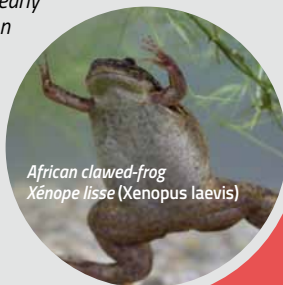
African clawed-frog Xénope lisse ( Xenopus laevis )