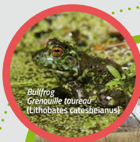
Bullfrog Grenouille taureau ( Lithobates catesbeianus )